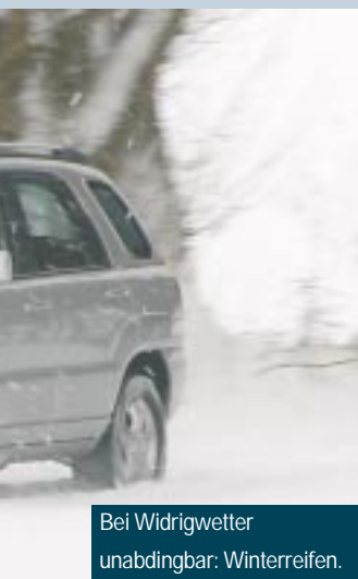
Bei Widrigwetter unabdingbar: Winterreifen.

Zu diesem Thema beantworten wir im nächsten Heft Leserfragen.