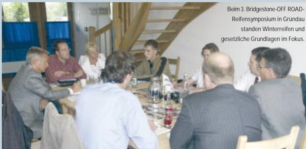
Beim 3. Bridgestone-OFF ROAD-Reifensymposium in Grundau standen Winterreifen und gesetzliche Grundlagen im Fokus.

Wird man bei Schmuddelwetter dann von der Polizei kontrolliert, ist man zumindest derzeit mit einem Reifen, der ein M+S-Zeichen trägt, noch vor einem Knöllchen sicher. Denn was soll die Polizei auch prüfen, wenn es als einzige Handhabe die alte StVZO-Regel bezüglich M+S-Zeichen gibt? Das müssen sich vorerst auch die Versicherungen gefallen lassen, die sich bei einem Kaskoschaden nicht auf grobe Fahrlässigkeit hinausreden können. „Dass ein M+S-