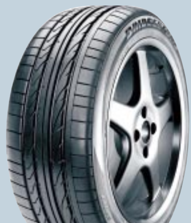
Bridgestone Dueler H/P Sport

M+S markierte Allrounder oder Ganzjahresreifen sind häufig nur bis 180 oder 190 km/h zugelassen. Das reicht für moderne SUV nicht mehr aus. Bei länger andauernder Überschreitung des Limits besteht sogar die Gefahr eines Reifenschadens.